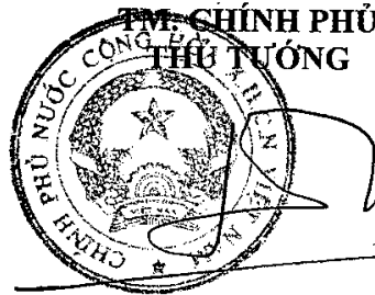
Nguyễn Tấn Dũng